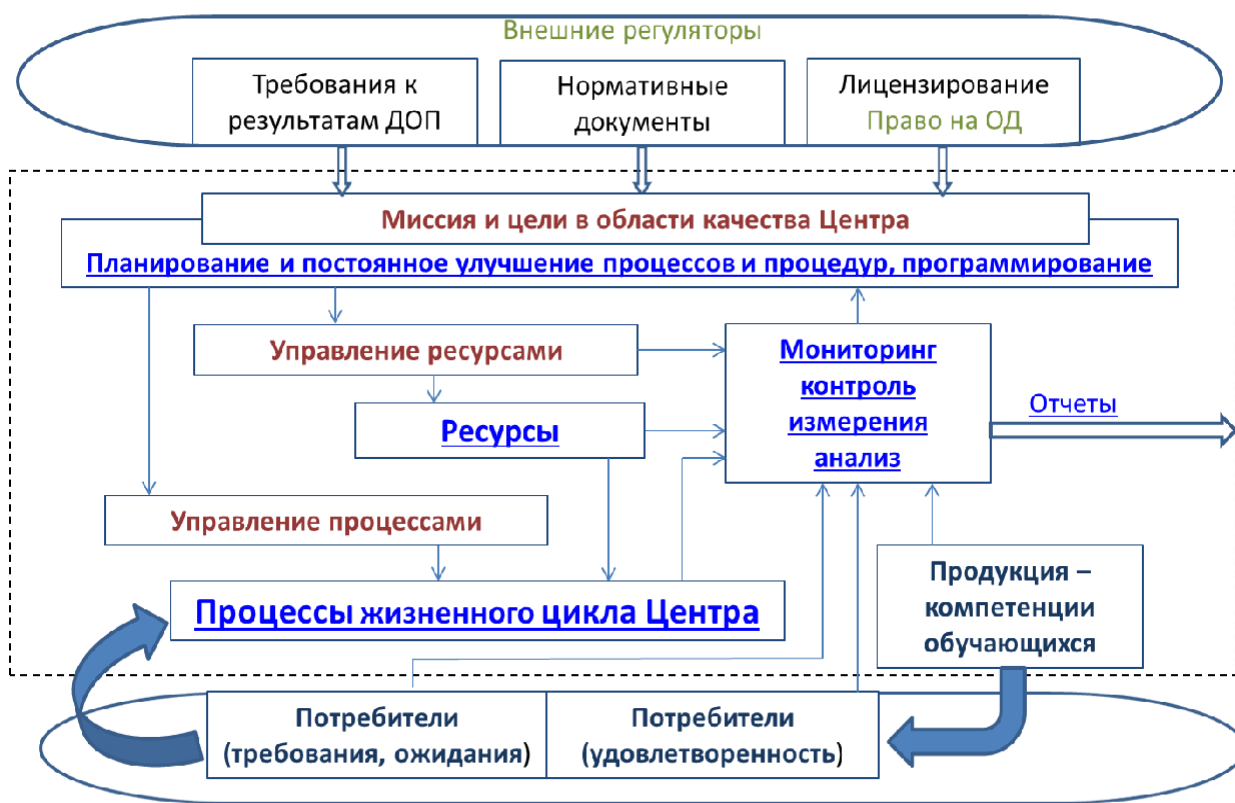
План контроля на 2024-2025 учебный год