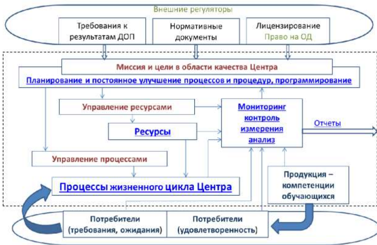
План контроля на 2023-2024 учебный год